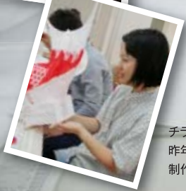
チラシ掲載写真は、 昨年受講された方たちの 制作風景です。